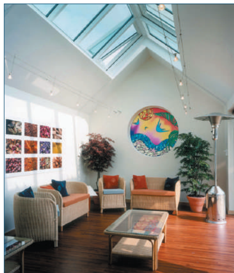
Helen House, Oxford (UK) - Soggiorno