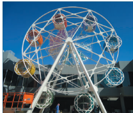
Bayt Abdullah Children's Hospice (Kuwait) - Giostra panoramica

chi o riserve naturali) pari anche a cento volte la superficie coperta, ricche di giardini e spazi verdi attrezzati dedicati ad attività di carattere ludico-ricreativo (gioco all'aperto, sport ecc.), terapeutico (giardini multisensoriali per aromaterapia, pet-therapy ecc.), spirituale-meditativo.