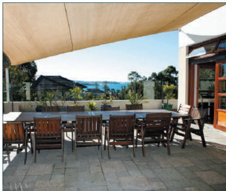
Bear Cottage, Manley (Australia) - Soggiorno all'aperto