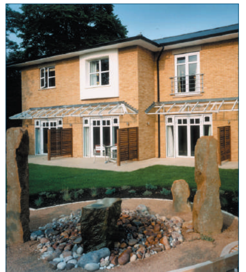
Helen House, Oxford (UK) - Vista esterna sulle camere