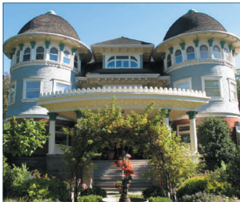
Canuck Place Children's Hospice, Vancouver (Canada) - Esterno