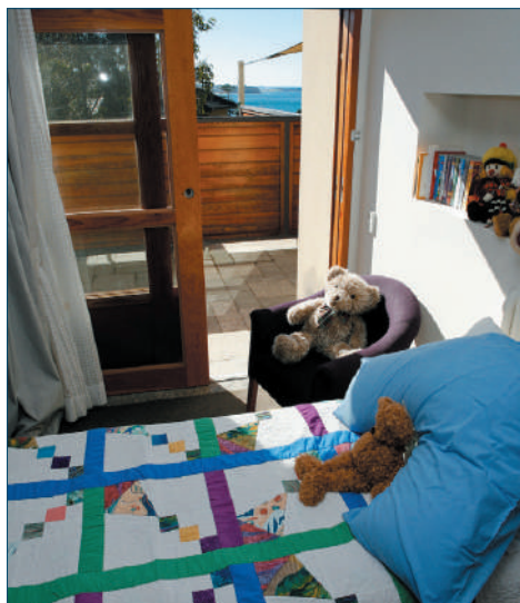
Bear Cottage, Manley (Australia) - Camera