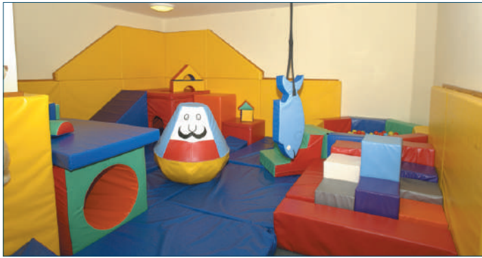
Christopher's Children's Hospice Guilford (UK) - Spazio per il gioco soft

Va fatto notare infatti che, rispetto alle strutture dedicate agli adulti, le notevoli differenze che si rilevano negli hospice pediatri-